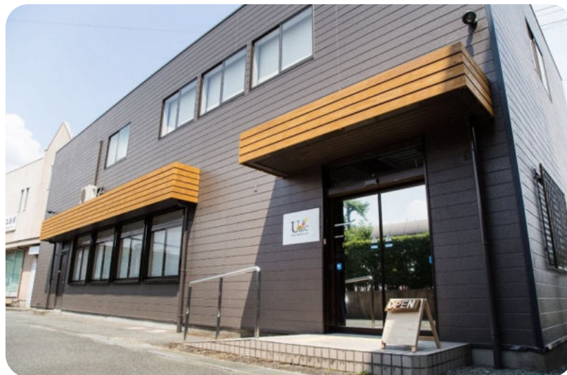
創業・移住・職業紹介のワンストップ相談窓口(U-BIC)の外観