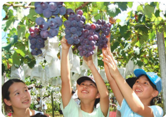
[うきはのフルーツカレンダー]