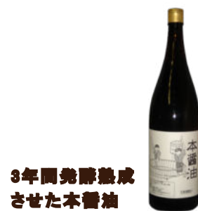
3年間発酵熟成させた本醤油