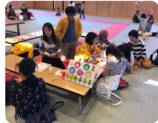
緑の募金活動の一環(木の折り紙作り)