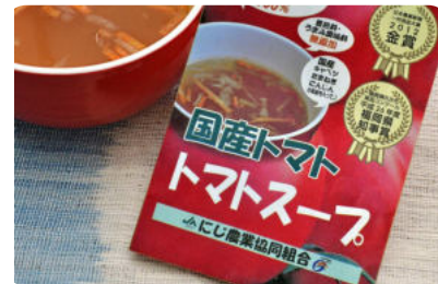
「桃太郎」を使用したトマトスープ