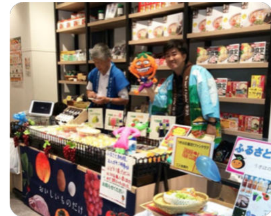
市長から「うきはスイーツ案内課」プロジェクトメンバーへの褒状交付の様子