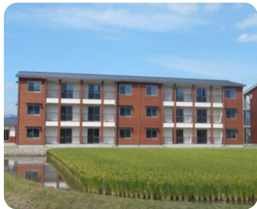
公共建築物(市営住宅新治園地)の外観