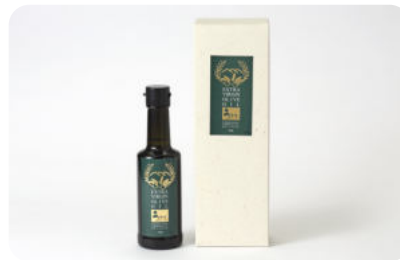
うきは産100%エキストラバージンオリーブオイル