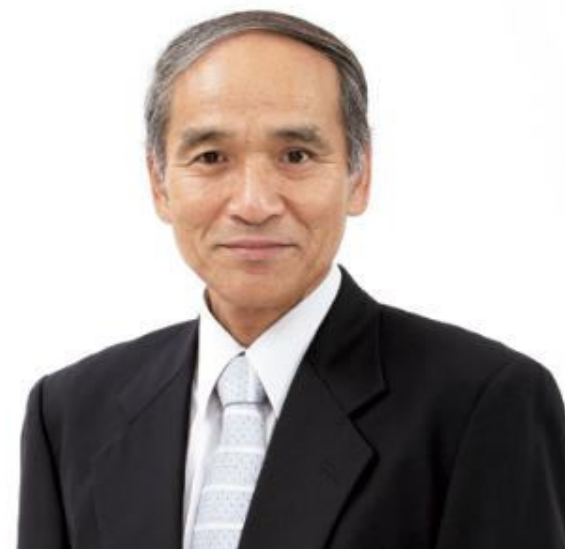
うきは市長 高木 典雄

うきは市には、地域を支える様々な産業や技術、人材、そして九州一の大河「筑後川」と屏風山と称される美しい「耳納連山」に抱かれた地理的環境、さらには、柿やブドウなどの農産物に恵まれたフルーツ産地、風光明媚な自然環境、景観など豊かな観光資源を有しています。このようなうきは市が有する様々な地域資源やその強みを活かし、全国の方々にうきはの魅力をお届けできるよう、うきは市は「うきはテロワールの恵みを生かしたフルーツ、農畜産物等の加工品群と観光農園」をふるさと名物として応援していくことを宣言いたします。