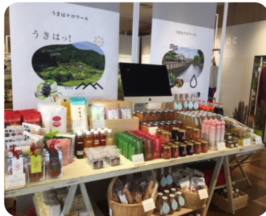
市長から「うきはスイーツ案内課」プロジェクトメンバーへの褒状交付の様子