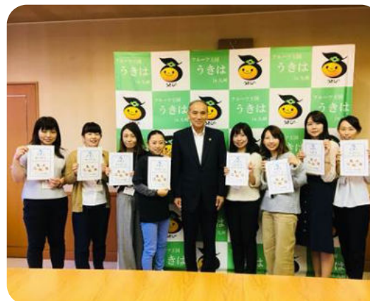
市長から「うきはスイーツ案内課」プロジェクトメンバーへの褒状交付の様子