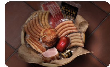
耳納いっーとんを使用した加工品