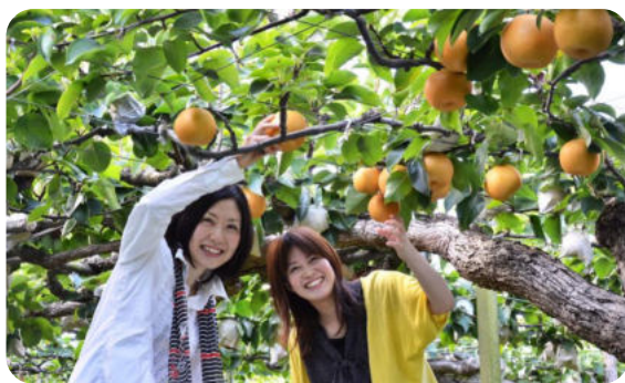
[フルーツ品種の多さ]