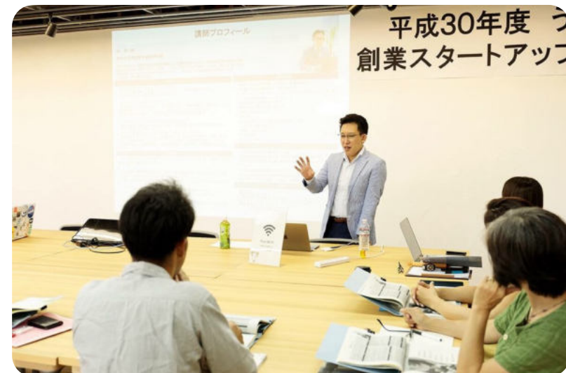
創業スタートアップセミナーの様子