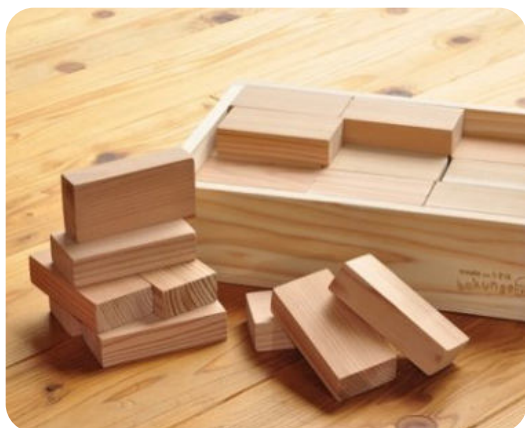
耳納杉を使ったつみき